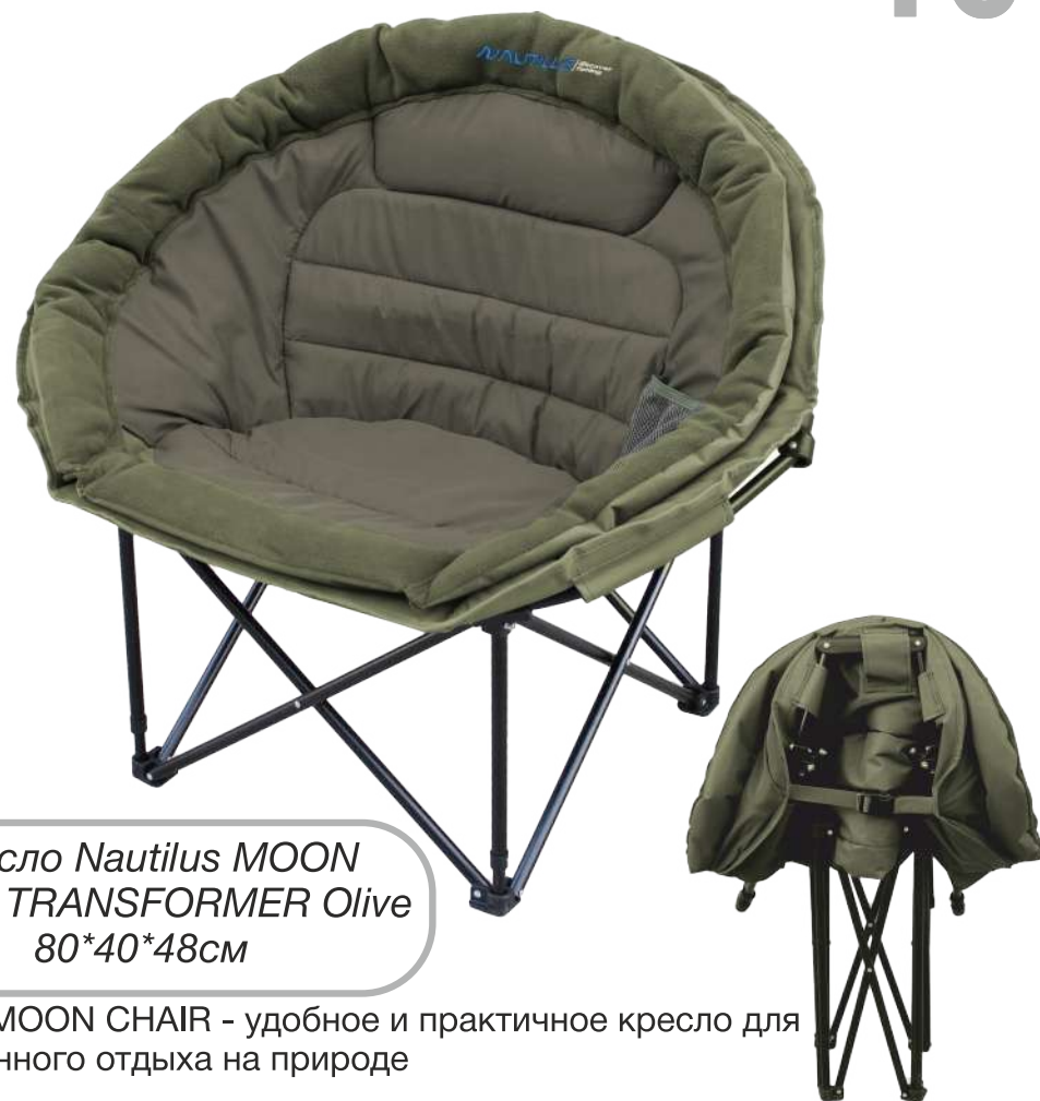
Кресло Nautilus MOON CHAIR TRANSFORMER Olive 80*40*48см

Кресло MOON CHAIR - удобное и практичное кресло для полноценного отдыха на природе