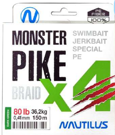
Шнур Nautilus Monster Pike Braid X4 Dark Green