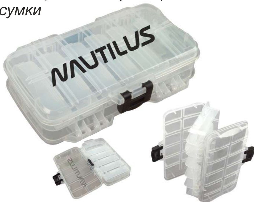
Коробка Nautilus NN2-230

Двусторонняя коробочка с надежными замками и возможностью регулировки отделений. Отлично помещается в карман рыболовной сумки