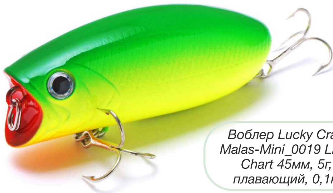
Воблер Lucky Craft Malas-Mini_0019 Lime Chart 45мм, 5г, плавающий, 0,1м

Эта уникальная приманка относится сразу к нескольким классам. В первую очередь это SSR воблер. На равномерной проводке он заглубляется максимум на 10 сантиметров, при этом активно вихляя из стороны в сторону. Соответственно, чем ниже скорость подмотки лески, тем выше к поверхности будет идти приманка, оставляя за собой «усы». Но стоит начать совершать рывки удилицем, как Malas из воблера превращается в поппер, создавая характерное бульканье и разбрызгивая воду. Щука и окунь великолепно ловятся на этого малыша на мелководных участках водоемов, заросших травой.