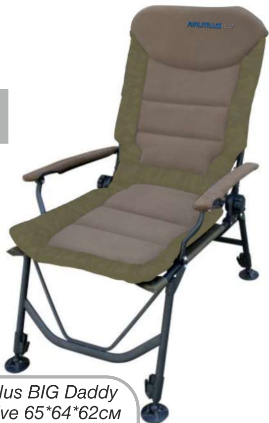
Кресло Nautilus BIG Daddy Carp Chair Olive 65*64*62см нагрузка до 150кг

Удобное и комфортное карповое кресло для отдыха и работы с монтажами