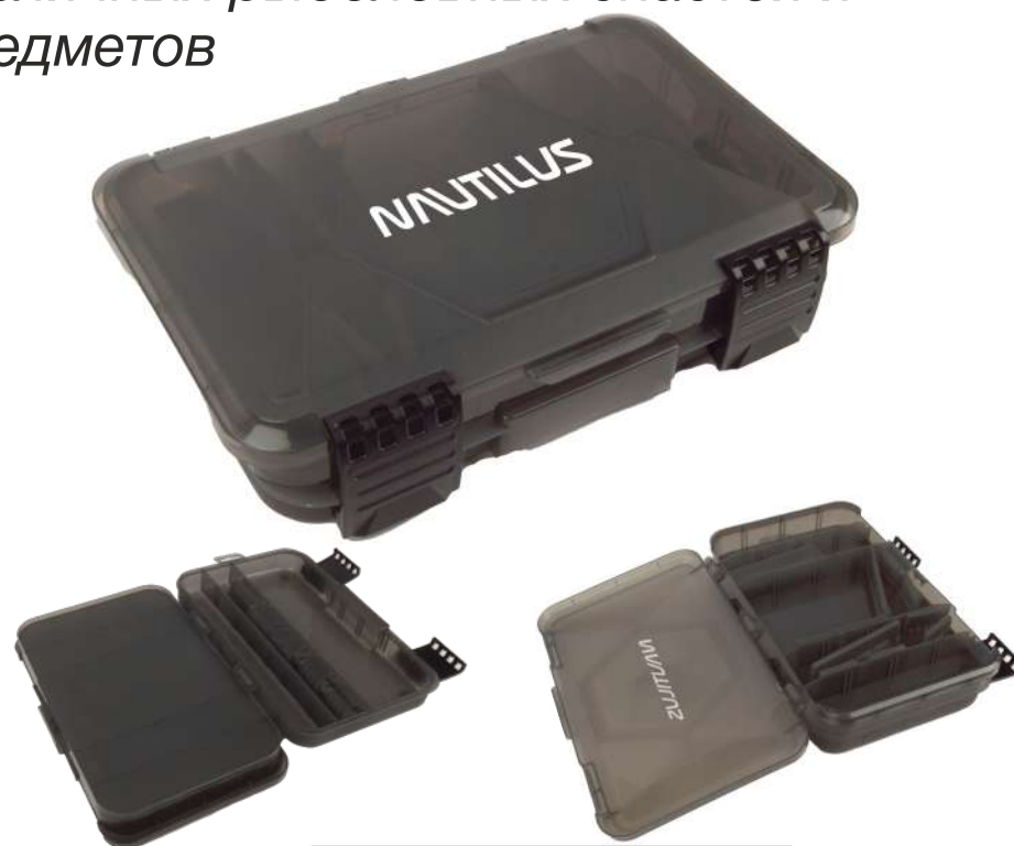
Коробка Nautilus NN2-360

Большая, габаритная коробочка, для хранения и транспортировки различных рыболовных снастей и предметов